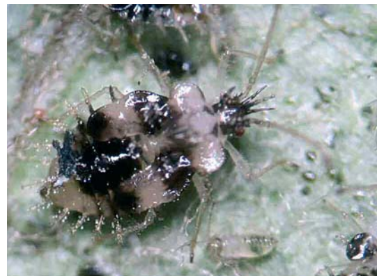
Larve du Tigre du poirier

et plat, pas d'ocelles 3 , des ailes normales ou courtes selon les individus au sein d'une même espèce. Les tigres vivent à la face inférieure des feuilles, dont ils ponctionnent les liquides intracellulaires (opophages) ; généralement, imagos (clairs) et larves