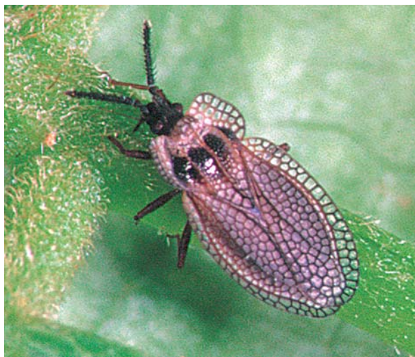
Derephysia foliacea