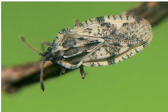
Tingis cardui

sont pondus par groupes de 15 à 100 à la face inférieure du limbe. La larve, d'un gris foncé avec des épines sur le corps, montre des taches blanches à partir du 3 e stade. On dénombre 3 générations complètes et une partielle par an.