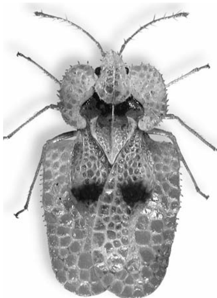
Tigre du platane