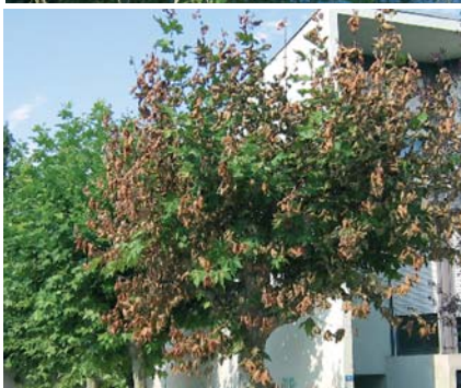
Symptômes d'une attaque modérée (en haut, sur les bords du canal du Nivernais) et avancée (en bas, en ville à Montpellier) du Tigre du platane

(sombres) cohabitent parmi leurs exuvies blanches et leurs crottes noires, au milieu de leurs œufs.