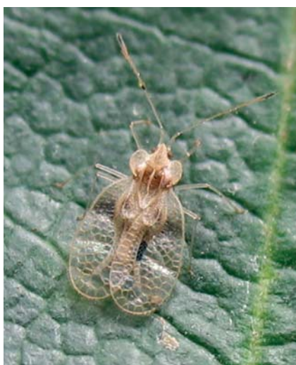
Le Tigre du rhododendron

sur platane 4 . On le détermine donc sans peine. L'adulte, blanchâtre, mesure 3 mm de long. Il hiverne sous les rhytidomes, résistant aisément à -10°C. À la belle saison, les survivants se portent sur le feuillage, où les femelles pondent de 200 à 350 œufs chacune le long des nervures. Les larves sont noires. Il y a 3 à 4 générations dans l'année.